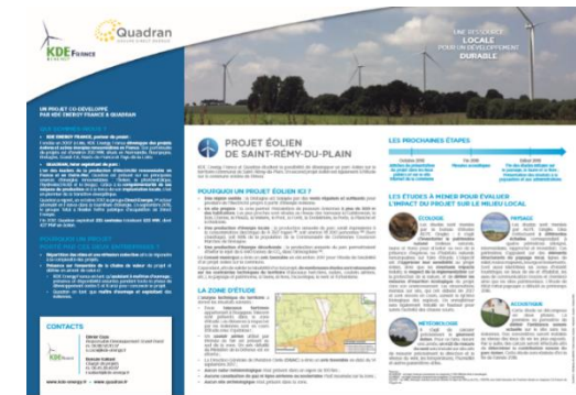
Aperçu de l'affiche de communication