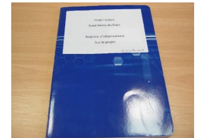
Registre disponible en mairie